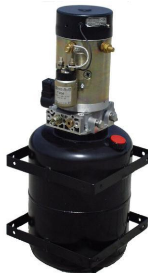
Compact Unit 24VDC