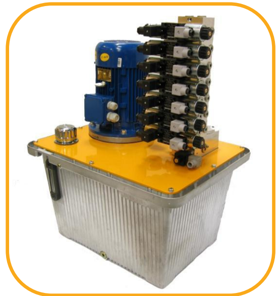
PowerPack 70 liter, 7 functies

In de onderstaande kolom volgt uit de gewenste maximale druk en de benodigde liters per minuut het vermogen van de elektromotor en de grootte van de tank.