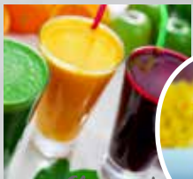
Glaswerk & Take away