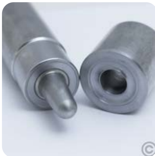
Eyelet Punch - Punzón para Ojales

000 GR HV 00 GR HV 0 GR HV 1 GR HV 2 GR HV 3 GR HV 4 GR HV 5 GR HV 6 GR HV 8 GR HV